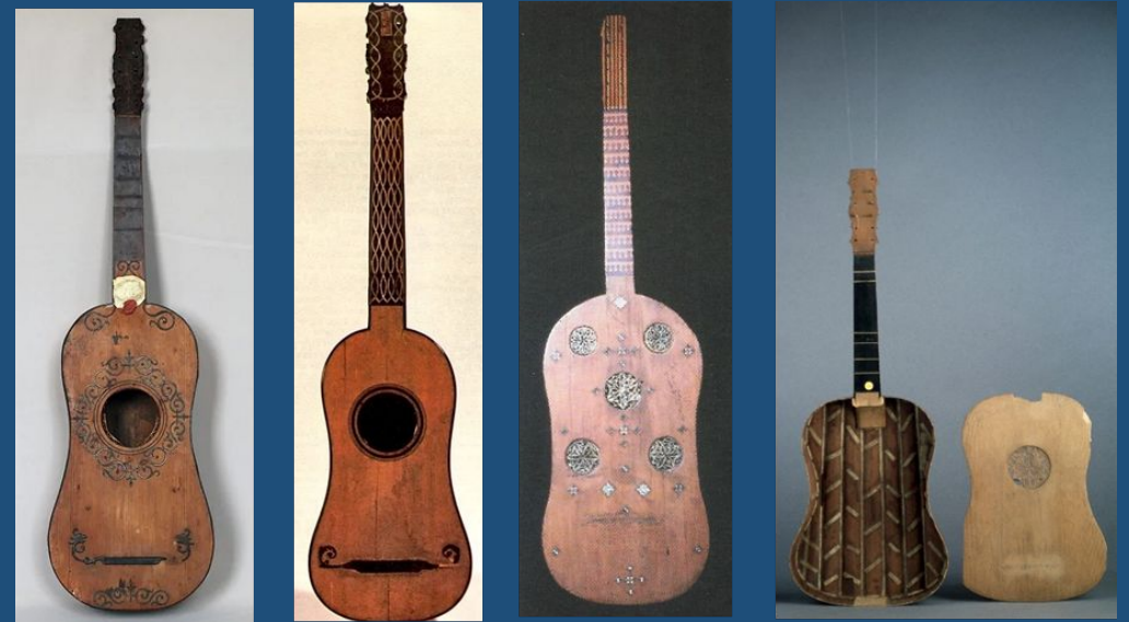
Figura 1. Comparativa de instrumentos. De izquierda a derecha: Vihuela de Quito o Marianita (ca. 1600); Vihuela/guitarra de Belchior Dias 1581; Vihuela Guadalupe primera mitad del siglo XVI; Vihuela E.0748 o Chambure, finales del siglo XVI.