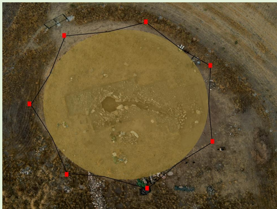
Fig. 2. Esquema de la colocación de membrana plástica.