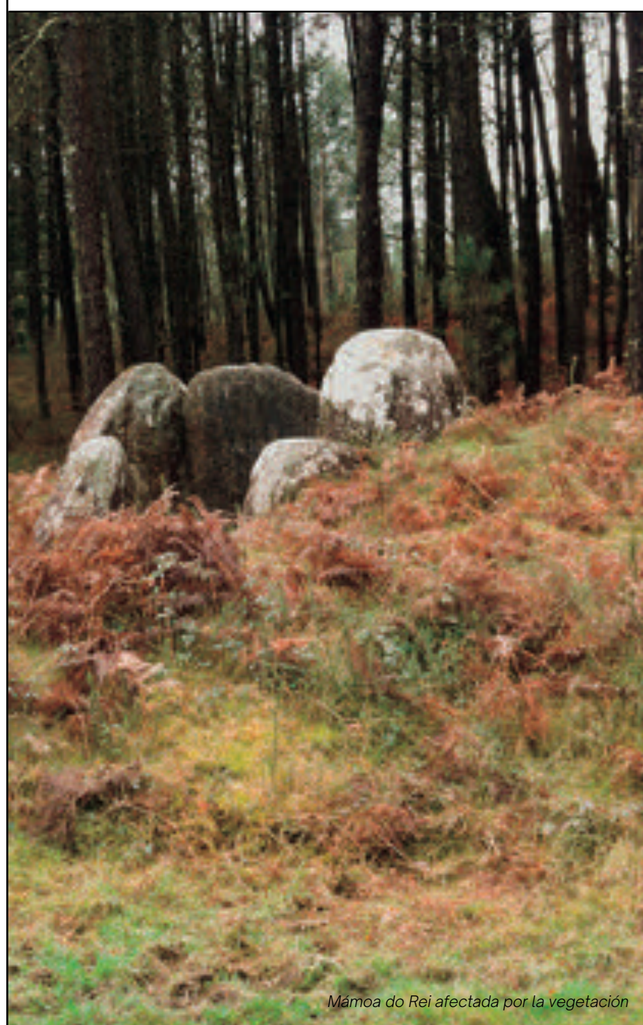
Mámoa do Rei afectada por la vegetación