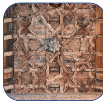
Figura 4. Armadura Santa Baia de Beiro (Ourense)

Plantear una aproximación al volumen, particularidades y vulnerabilidad de las armaduras pintadas ha demostrado ser una decisión con buenos resultados: en este tiempo se pudo reunir un total de veinticuatro armaduras pintadas de importante significación, aunque es muy probable que se conserve un número mucho más elevado. La disociación se presenta como uno de los factores que más ha contribuido al deterioro de estas estructuras. Por esta razón, el planteamiento de estrategias que ponen el foco en la necesaria catalogación, en el estudio de su vulnerabilidad y sobre todo en difusión resulta fundamental. Se hace necesario resaltar la conveniencia de la estrategia de difusión para comenzar a ejercer una protección real porque su protección está estrechamente vinculada con su valoración social.