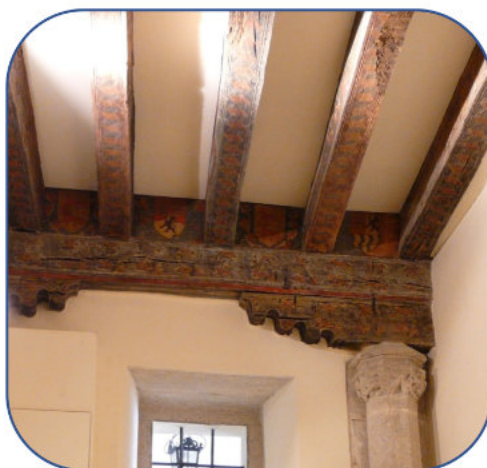
Figura 2. Armadura edificio obispado (Lugo).