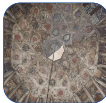
Figura 5. Armadura San Pedro de Lugo.