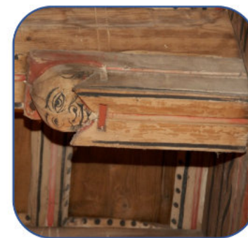
Figura 4. Armadura Xunqueira de Espadañedo (Ourense)