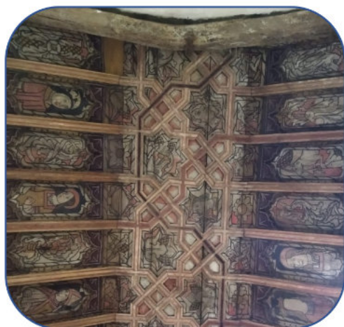
Figura 1. Armadura San Roque de Mazaeda (Lugo).

En Galicia se conservan un considerable número de armaduras pintadas poco conocidas y escasamente valoradas: cuando se habla de techumbres pintadas en la península ibérica lo primero que viene a la mente es la tradición mudéjar desarrollada sobre todo en el sureste ¿es que en el norte no hemos experimentado la arquitectura desde dentro? Este trabajo es, pues, un primer acercamiento al tema a través de la conservación preventiva.