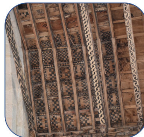
Figura 3. Armadura Augas Santas (Ourense)