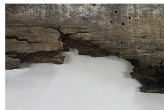
Hongos de pudrición