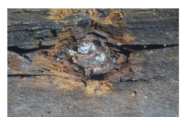
Oxidación de clavos