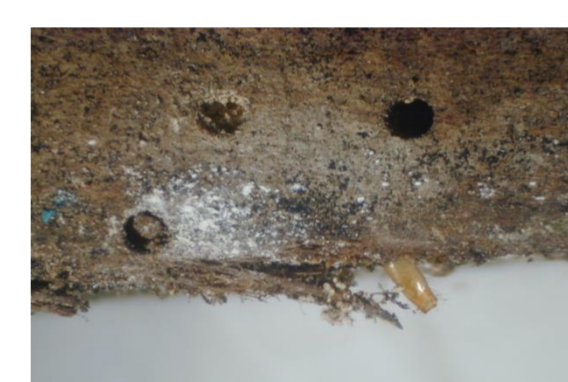
Ataque de xilófagos