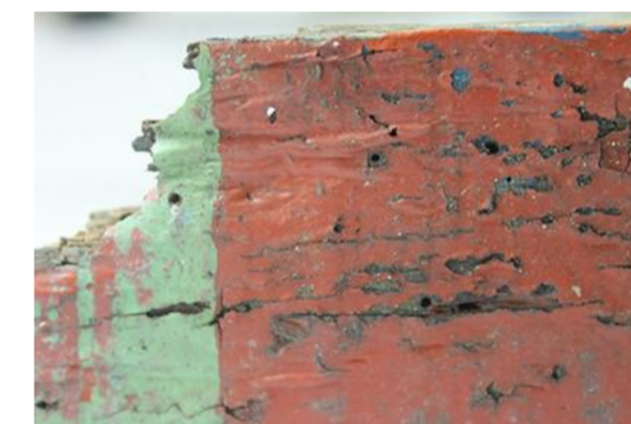
Arrugas y abolsados