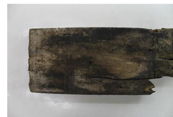
Manchas de humedad